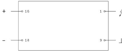
Montagesockel (LxBxH): 158x75x35mm Base (LxWxH): 158x75x35mm